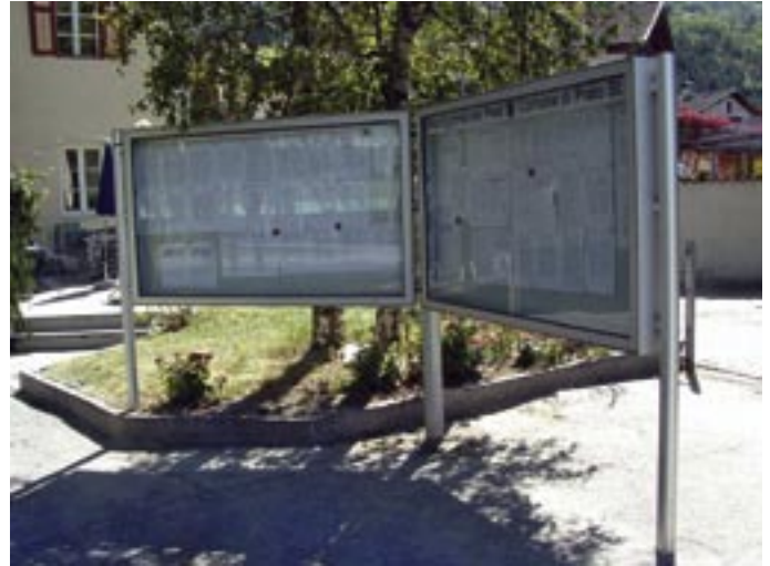
Während der Veröffentlichung können Einsprüche gegen Beschlüsse eingereicht werden.

eingereicht und protokolliert werden. Jeder Einspruch muss natürlich die Angaben zum Beschluss und die Gründe der Beanstandung enthalten. Weiters können zweckdienliche Unterlagen und Gutachten beigelegt werden. Wird ein Einspruch von mehreren Interessierten unterzeichnet, so muss eine Person mit Adresse angeführt werden, an welche alle Mitteilungen in diesem Zusammenhang stellvertretend für alle Unterzeichner zu richten sind. Der Gemeindeausschuss entscheidet innerhalb 30 Tagen ab Vorlage über den Einspruch. Falls der Einspruch gegen einen Beschluss des Gemeinderates gerichtet ist, wird der Ausschuss dem Gemeinderat in seiner nächsten Sitzung einen Beschlussvorschlag unterbrei-