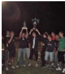
Siegermannschaft Fc Müstair

In vielen Dörfern gibt es so genannte Fußballfreizeitmannschaften, so auch in Prad. Jedoch stach eine dieser vielen Ende Juni besonders hervor, die Rede ist von Larifari aus Prad. Denn die Mannschaft, welche aus jungen begeisterten Fußballern besteht, organisierte heuer erstmals das Larifari-Turnier in der Prader Sportzone.