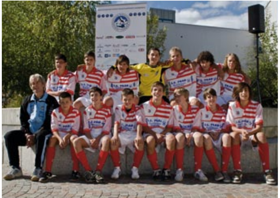
Giovanissimi – Sie eröffneten mit einem Sieg die Meisterschaftssaison des ASV Prad/Raiffeisen Werbering