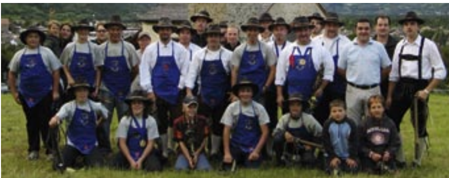
Ein Großteil der Goaßlschnöller Prad

Die heurige Goaßlschnöller-Weltmeisterschaft fand vom 28. bis 29. Juli mit dem Gastgeber Taisten erstmals in Südtirol statt.