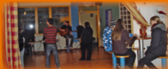
Reggae-Konzert im Jugendtreff