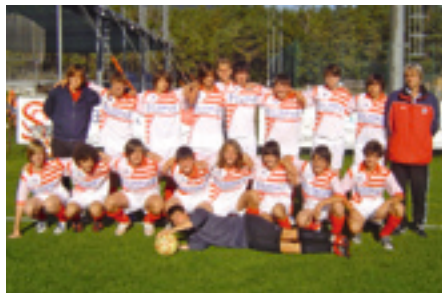
Die Allievi-Mannschaft des ASV Prad

Diese Mannschaft spielte heuer das 1. Mal auf dem Großfeld. Der Kader besteht aus 20 Spielern. Die Meisterschaftsspiele verliefen größtenteils reibungslos, schade war nur, dass die Sonntagsspiele fast alle verloren gingen (warum wohl?). Unser höchster Sieg war 14:0 gegen Kastellbell und unsere höchste Niederlage war gegen Meran mit 4:1. Mit einem Torverhältnis von 42:10 und 16 Punkten erreichten wir die Leistungsklasse A.