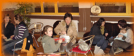
Eltern und Geschwister im Treff